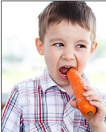
Ein deutscher Junge isst eine Rübe

[< https://www.google.co.za/search?biw=1366&bih=662&tbm=isch&sa=> ]