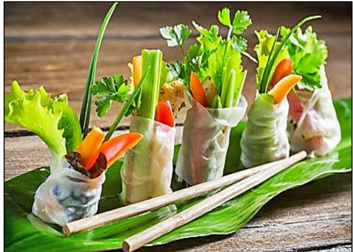
In asiatischen Ländern essen die Einwohner gern Gemüse

[< https://www.google.co.za/search?biw=1366&bih=662&tbm=isch&sa=> ]